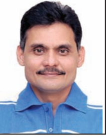
તંત્રી - પ્રકાશ સ્વદેશ

લદાખની ગલવાન ખીણમાં ૧૫ દિવસ પહેલા ચીને ભારતના વીસ જવાનોની હત્યા કરી હતી. આ ઘટનાને પગલે હજી સુધી સરહદ પર બંને પક્ષે તંગદીલીનો માહોલ છે. ઘટના બાદ ભારતે હજી સુધી કોઈ લશ્કરી કદમ ઉઠાવ્યા નથી. માત્ર સૈનિકોની તૈનાતીમાં વધારો કરવો અને ટોપ, ટેન્કર ખડકવા સિવાય કશું કરાયું નથી. તેથી ચીને પાછો સરહદે લશ્કરનો ખડકલો કરવા માંડ્યો છે. બુધવારે જ અરૂણાચલ પ્રદેશથી માંડીને લદાખ સુધી એલએસી આસપાસની સેટેલાઈટ તસ્વીરો બહાર આવી હતી. જેમાં ચીને અનેક વિસ્તારમાં પોતાના કેમ્પ બનાવ્યા હોવાનું જોઈ શકાયું હતું. અરે, ગુજરાત તરફ સરહદથી ૨૦ કિમી દૂર જ પાક.માં ચીને એરબેઝ તૈયાર કરવા માંડ્યા છે. આ વખતે લદાખ સિવાય બીજા વિસ્તારોમાં પણ ચીને લશ્કર ઠાલવવા માંડ્યું છે અને તેની સામે ભારતે પણ સૈનિકોને ગોઠવી દીધા છે કે જેથી ગલવાન જેવી ઘટનાનું પુનરાવર્તન ના થાય. ભારતમાં લશ્કરના કારણે સરહદો સચવાયેલી છે. લશ્કરને પોતાની જવાબદારી અને ફરજો શું છે તેની ખબર છે જ. લશ્કરે એ નિભાવવાની તૈયારી કરી જ રાખેલી હોય છે અને તેને માટે જે કિંમત ચૂકવવી પડે છે એ લશ્કર ચૂકવે પણ છે. પણ કમનસીબે દેશના શાસકોમાં એ જવાબદારીની ભાવના નથી.