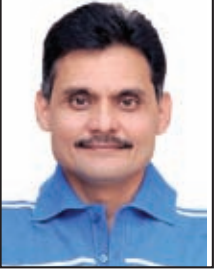
તંત્રી - પ્રકાશક સ્વદેશ

ભારતમાં બે-ત્રણ દાયકાથી શિક્ષિતો અને બુદ્ધિજીવીઓ શિક્ષણનીતિને લઈને સવાલો ઉઠાવતા હતા. આ લોકોનો તર્ક દેશની શિક્ષણનીતિ વર્ષો જૂની હોવા સાથે સમયને સુસંગત ન હોવાનો હતો. દરમિયાન કેન્દ્રની નરેન્દ્ર મોદી સરકારે બુધવારે નવી શિક્ષણનીતિને મંજૂરી આપી હતી.