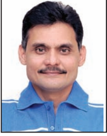
તંત્રી - પ્રકાશક સ્વદેશ

સુશાંતસિંહ રાજપૂતના રહસ્યમય મૃત્યુના કેસમાં તપાસના ધમધમાટ વચ્ચે રાજકીય ક્ષેત્રે પણ મોરચા મંડાઈ ચુક્યા છે. આમ તો બિહારમાં વિધાનસભાની ચૂંટણીને કારણે સુશાંત કેસને મીડિયામાં ભારે વજન અપાઈ રહ્યું છે. સેન્ટ્રલ બ્યુરો ઓફ ઈન્વેસ્ટિગેશન