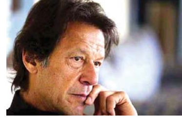
ભાગેડુ જાહેર કર્યા હતા.

ઈસ્લામાબાદ : પાકિસ્તાનમાં ટ્રેઝરી હાઉસ કેસ સંભાળી રહેલી સ્પેશિયલ કોર્ટે ભૂતપૂર્વ વડા પ્રધાન નવાઝ શરીફને ભાગેડુ જાહેર કર્યા હતા. સ્પેશિયલ કોર્ટમાં ચાલી રહેલી સુનાવણીમાં વારંવાર ગેરહાજર રહેવા બદલ સ્પેશિયલ કોર્ટે નવાઝ શરીફને અને એમના પરિવારના કેટલાક લોકોને