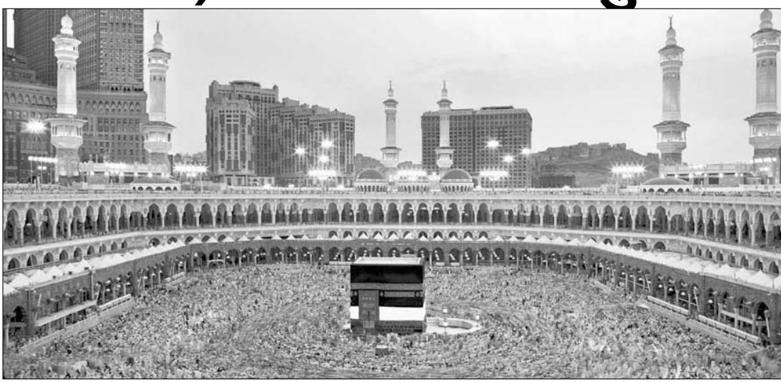
મુસ્લિમ ધર્મશાસ્ત્ર કુરાન મજુદના બોધવચનો પર આધારિત

ભાગ-૧ મુસ્લિમ ધર્મશાસ્ત્ર કુરાન મજુદના કુલ શ્લોકો(આયતો)ની સંખ્યા લગભગ ૬૨૦૦ કરતાં પણ વધારે છે. આ શ્લોકોને અરબી ભાષામાં “આયત” કહેવામાં આવે છે, અને અરબી શબ્દ “આયત”નું ભાષાંતર ગુજરાતી અને ઉર્દૂ ભાષામાં “નિશાની” થાય છે. બીજા શબ્દોમાં “આયાત” એટલે કે શ્લોક એક નિશાની સ્વરૂપે છે. કુરાન મજુદમાંની ૬૨૦૦ કરતાં પણ વધારે આયતોમાં અમુક આયતો ખાસ વિશિષ્ટ ધરાવે છે અને તેથી આ ખાસ આયતોના વિશિષ્ટ નામ પુરાતન કાળથી એટલે ૧૪૦૦ વર્ષ પહેલા ઈસ્લામના અંતિમ પયગંબર સહેબ (સ.અ.વ.)ના સમયથી પ્રચલિત થયેલ છે. આ વિશિષ્ટ નામોમાં “આયતુલ બિર” (ભલાની આયત, પ્રકરણ ૨, શ્લોક ૧૭૭), “આયતે કરીમા” (માન આદરણીય આયત), પ્રકરણ ૨૧, શ્લોક ૮૭), “આયતુલ કુરસી” (સત્તા, રાજ્ય, સિંહાસનની આયત, પ્રકરણ ૨, શ્લોક ૨૫૫) વગેરે. નીચે કુરાન મજુદના પ્રકરણ ૨ના શ્લોક ૨૫૫ એટલે કે “આયતુલ કુરસી” (સત્તા, રાજ્ય, સિંહાસનની આયત)નું ગુજરાતી ભાષાંતર આપવામાં આવે છે :- “બિલ્મીલ્લાહ અલ રહમાન અલ રહીમ.” “અલ્લાહના નામથી જે અત્યંત કૃપાળુ અને દયાળુ છે.” “અલ્લાહ સિવાય કોઈ પણ બીજો પુજવાને (બંદગીને) લાયક નથી. તે સજીવ (હયાત) અને સમસ્ત સૃષ્ટિનો રક્ષક છે. તે ન સુવે છે અને ન તેને ઝોંકું આવે છે. ધરતી અને આકાશોમાં જે કંઈ છે, તે સર્વનો માલીક તે જ છે. કોણ છે જે તેની હજુરમાં તેની પરવાનગી વગર કોઈની ભલામણ કરી શકે? જે કંઈ લોકો સમક્ષ ખુલ્લું છે તેને પણ તે જાણે છે અને જે કંઈ તેમનાથી