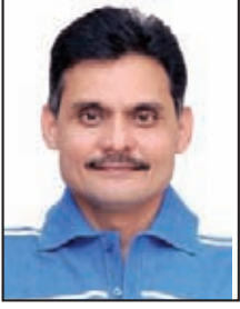
તંત્રી - પ્રકાશક સ્પેશ

કોરોના એ ૨૦૨૦માં સમગ્ર દુનિયામાં પર ત્રાટકેલું વાયરસરૂપી સૌથી ભયંકર કેર છે. જેને કારણે દુનિયાના દરેકને તેની અસર થઈ છે. પરંતુ કોરોનાનો સૌથી વધારે માર ગરીબ બાળકોને પડ્યો છે. સંયુક્ત રાષ્ટ્રની પેટાસંસ્થા યુનિસ્કે અને સેવ ધ ચિલ્ડ્રન તરફથી પ્રકાશિત રિપોર્ટ કહે છે કે, કોરોના સંકટને કારણે ૧૫ કરોડથી વધારે બાળકો ગરીબીમાં ધકેલાઈ ગયા છે. મહામારી અને એના કારણે લાગુ કરવામાં આવેલા લોકડાઉનના કારણે ઓછી અને મધ્યમ આવકવાળા દેશોમાં ગરીબીમાં રહેતા બાળકોની સંખ્યા વધીને ૧.૨ અબજ થઈ ગઈ છે. લોકડાઉનના કારણે વાયરસના સંક્રમણને અટકાવવામાં મદદ મળી છે. પરંતુ એના માઠા પરિણામો સામે આવી રહ્યાં છે. ગરીબીને લઈને દુનિયાભરમાં ઉદાસીનતા છે એ જોતાં ૧૫ કરોડ બાળકોના આંકડાને લોકો કદાચ ગંભીરતાથી નહીં લે, પરંતુ કોરોનાના કારણે આવનારા સંકટનો અછડતો અંદાજ લગાવી શકાય છે. મહામારીને કારણે દુનિયામાં ભૂખમરોની સ્થિતિ અત્યંત ચિંતાજનક બની રહી છે. ખોરાક ન મળવાને કારણે દર મહિને દસ હજારથી વધારે બાળકોના મૃત્યુ નીપજી રહ્યાં છે. યૂ.એન.ના એક રિપોર્ટમાં નોંધાયું કે, ગામડાઓમાં પેદા થયેલા ઉત્પાદનો બજાર સુધી પહોંચી શકતા નથી અને ગામડાઓમાં ખાદ્ય અને મેડિકલ સપ્લાય પહોંચી શકતા નથી. વાઈરસના કારણે થયેલી ભોજન સામાગ્રીના સપ્લાયમાં અડચણ ઉભી થતાં એક વર્ષમાં એક લાખ વીસ હજાર બાળકોના મૃત્યુ નીપજી શકે છે. સંયુક્ત રાષ્ટ્રના જણાવ્યા અનુસાર દર મહિને સાડા પાંચ લાખથી વધારે બાળકો કુપોષણના શિકાર બને છે. યૂ.એન.ની ચાર એજન્સીઓએ ચેતવણી આપી છે કે, વધી રહેલા કુપોષણના લાંબા ગાળાના પરિણામ ભારે નુકસાનકારક હોઈ શકે