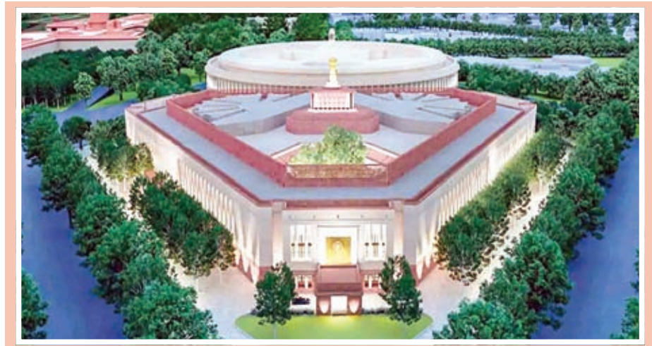
૬૪,૫૦૦ વર્ગ મીટર ક્ષેત્રફળમાં ૯૭૧ કરોડના ખર્ચે તૈયાર થનારા ભવનમાં વિશાળ બંધારણ ક્ષણ ઉપરાંત સમિતિઓ માટે ખંડ, પુસ્તકાલય, કેન્ટિન, પાર્કિંગ માટે સુવિધા હશે