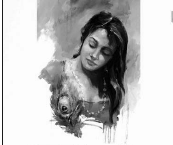
દેવેન્દ્ર પટેલની શ્રેષ્ઠ વાર્તાઓ - ૨

રંગનું સ્કૂટર હશે.' 'હું ક્યારનોયે બેઠોબેઠો એ સ્કૂટરની રાહ જોઈ રહ્યો છું.' કરી. 'માત્ર કરિયર જ નહીં... એના ધંધા પણ ક્યાં સારા છે!'