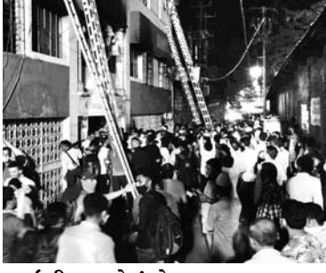
આઈસીયુ આવેલું છે.

માંડવી પાણીગેટ વચ્ચે આવેલી ટ્રસ્ટ સંચાલિત શ્રી વિજય વલ્લભ સાર્વજનિક હોસ્પિટલના પહેલા માળે ઓપીડી અને ઓફિસ આવેલી છે. જ્યારે તેની ઉપર બીજા માળે જનરલ પેશન્ટોને દાખલ કરવામાં આવે છે. ત્રીજો માળ કોવિડ પેશન્ટો માટે છે અને ચોથા માળે