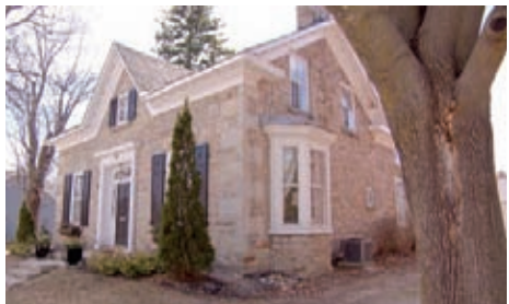
સરકાર દ્વારા ઓછા વ્યાજે લોન મળતાં માર્કેટની સ્થિતિ સુધરી, માર્ચના પખવાડિયામાં ૬૫૦૪ મકાનો વેચાયા

ટોરોન્ટો : ટોરોન્ટો રિજિયોનલ રીયલ એસ્ટેટ બોર્ડના મંગળવારે બહાર પડેલા અહેવાલ અનુસાર ટોરોન્ટોમાં મકાનોની કિંમતમાં ગયા વર્ષના માર્ચ મહિનાની સરખામણીમાં બમણો વધારો થયો છે. ગયા વર્ષે આ સમયે કોવિડ-૧૯નો ફેલાવો વધતા જે મહામારીની સ્થિતિ સર્જાઈ હતી, ત્યારબાદ મકાનોની કિંમતો ઘટી ગઈ હતી. પરંતુ આ વર્ષે એ વિસ્તારમાં ગયા વર્ષના ૭૮૪૫ મકાનોની સામે લગભગ ૯૫ ટકા વધારા સાથે ૧૫,૬૫૨ મકાનો વેચાયા હતા.