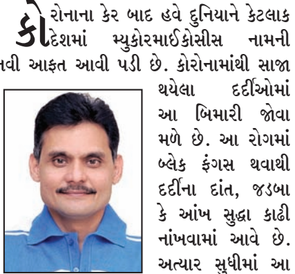
તંત્રી - પ્રકાશક સ્વદેશ