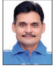
તંત્રી - પ્રકાશક સ્વદેશ

અફઘાનિસ્તાનમાં અમેરિકી સૈન્યએ સૌથી મોટું થાણું બગરામ બેઝ ખાલી કરી દીધું છે. અમેરિકાના જવાનોએ આફઘાનિસ્તાનની ભૂમિ છોડવાની શરૂઆત કરી કે તરત જ બેઝમાં લૂંટફાટ થવા માંડી છે. વળી, બગરામના અફઘાની બેઝ કમાન્ડર પણ અમેરિકી પલાયનથી અજાણ હતા. હવે અમેરિકન જવાનો વાહનો સમેત ૨૫ લાખથી વધુ સંખ્યામાં શસ્ત્રસરંજામ મૂકતા ગયા છે. જેથી તાલીબાનોએ તેનો ઉપયોગ કરવા માંડ્યો છે. અમેરિકી પ્રમુખ બિડેને અગાઉ ૩૧ ઓગસ્ટ, ૨૦૨૧ સુધીમાં આખું અમેરિકી સૈન્ય અફઘાનિસ્તાનમાં ખાલી કરી દેશે તે બાબતની ઘોષણા કરી હતી. આજે મોટાભાગના નાટો અને અમેરિકી સૈનિકો પોતાને દેશ પાછા ફરી ચૂક્યા છે. અમેરિકી પ્રમુખ નફ્ટાઈથી કહી ચૂક્યા છે કે, અમેરિકા અફઘાનિસ્તાનમાં રાષ્ટ્ર-નિર્માણ માટે નહોતું ગયું અને અફઘાનીઓએ તેમનું ભવિષ્ય જાતે નક્કી કરવાનું રહેશે. હવે અમેરિકાએ આફઘાનિસ્તાનમાં રસ ઓછો કરતા દિવસેને દિવસે તાલિબાન દ્વારા એક પછી એક પ્રદેશો કબજે કરવામાં આવી રહ્યા છે. આ સાથે જ ફરી તાલિબાનોનો કૂર ચહેરો દુનિયાની સામે આવી રહ્યો છે.