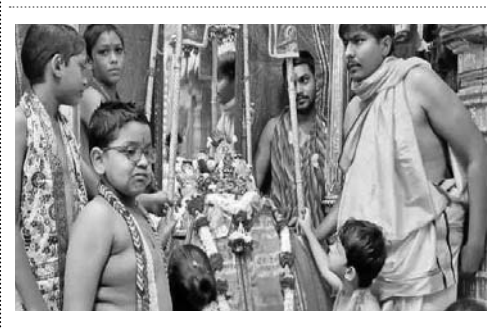
ડાકોરમાં હિંડોળાનો પ્રારંભ થયો છે. ઠાકોરજીને કેસરનો એક ભોગ વધુ ધરાવવામાં આવ્યો હતો. ડાકોરમાં મોટી સંખ્યામાં ભક્તો આજે હિંડોળાદર્શન માટે ઉમટ્યા હતા. આજથી એક માસ સુધી ગોપાલલલાજીને વિવિધ પ્રકારના સુશોભિત હિંડોળામાં ગુલાવવામાં આવશે. તિલક કરીને ગોપાલલલાજીને હિંડોળે બેસાડવામાં આવ્યા હતા.