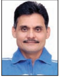
તંત્રી - પ્રકાશક સ્વદેશ

ભારતના પૂર્વોત્તરના મિઝોરમ, મેઘાલય અને આસામ વચ્ચે વર્ષોથી સરહદને લઈને વિવાદ ચાલી રહ્યો છે. આ મુદ્દે ત્રણેય પ્રદેશો વચ્ચે નાના મોટા છમકલા થતાં રહ્યા છે. પરંતુ આસામ અને મિઝોરમ વચ્ચેનો આ વિવાદ હવે ચરમસીમાએ પહોંચી ગયો છે. પાંચ દિવસ પહેલાં જ બંને પ્રદેશોની પોલીસ વચ્ચે થયેલી જૂથ અથડામણમાં આસામ પોલીસના પાંચ જવાનના મોત નિપજ્યા હતા. ભારતમાં બે રાજ્યો વચ્ચેનો વિવાદ ઉગ્ર અને હિંસક બને એ નવી વાત નથી. દક્ષિણ ભારતનાં રાજ્યોમાં નદીઓના પાણી કે ભાષાને મુદ્દે ચાલતા વિખવાદ વર્ષો પછી પણ યથાવત છે. પણ સરહદી ઝગડામાં બે રાજ્યોની પોલીસ સામસામે આવી જાય અને બંને વચ્ચે ગોળીબાર થાય, તેમાં એક રાજ્યના પોલીસો મરી જાય એવું સોમવાર પહેલાં બન્યું ન હતું. સોમવારે આસામ અને મિઝોરમના સરહદના ઝગડામાં પાંચ જવાનોના મોતની ઘટના સમગ્ર દેશ માટે કાળી ટીલી સમાન છે.