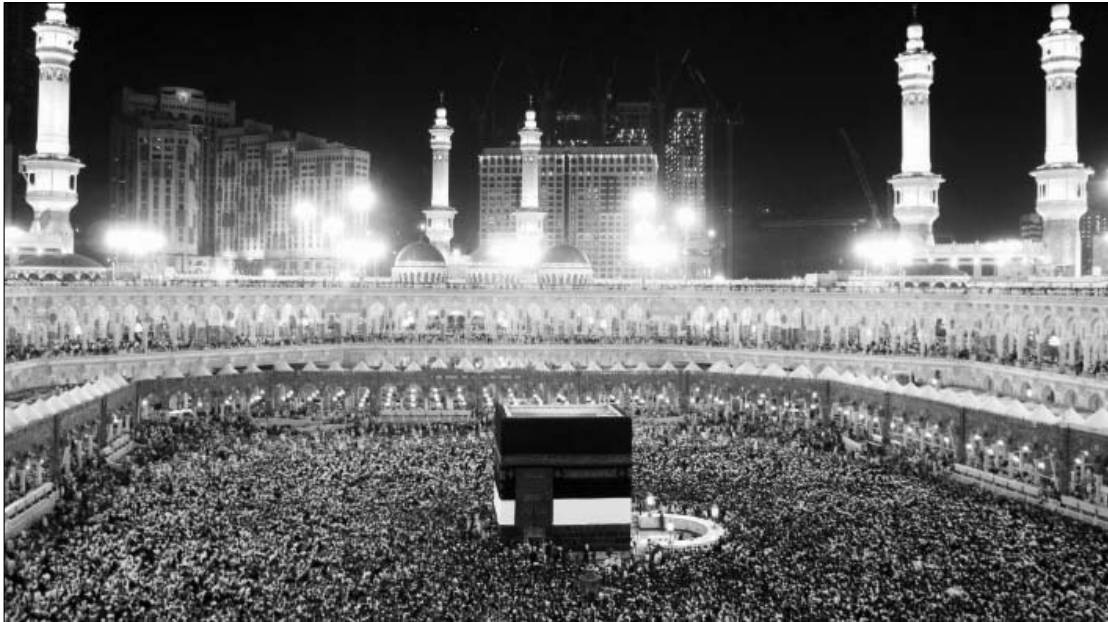
મુસ્લિમ ધર્મશાસ્ત્ર કુરાન મજહદના બોધવચનો પર આધારિત

“હે શ્રદ્ધાળુઓ (મોમીનો-ઈમાનવાળાઓ), એ જરૂરી છે કે તમારા દાસદાસીઓ અને તમારા એ બાળકો, જેઓ હજી પુખ્તવયના નથી થયેલ, ત્રણ સમયે તમારી પરવાનગી મેળવીને જ તમારી પાસે આવે. (આ ત્રણ સમય આ