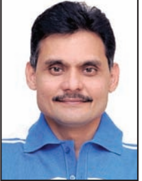
તંત્રી - પ્રકાશક સ્વદેશ

2021માં ભારતીય શેરબજારમાં આવેલા ઉછાળાનો સિલસિલો ચાલુ રહ્યો છે. ચાલુ વર્ષે અત્યાર સુધી