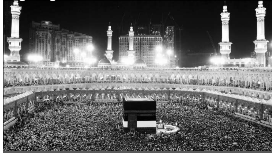
મુસ્લિમ ધર્મશાસ્ત્ર કુરાન મજીદના બોધવચનો પર આધારિત

ભાગ-૨ “ભલાઈ (નેકી)એ નથી કે તમે તમારા મુખ પૂર્વ તરફ અથવા પશ્ચિમ તરફ કરી લીધા. પરંતુ ભલાઈ(નેકી) એ છે કે કોઈ મનુષ્ય અલ્લાહને અને અંતિમ દિવસ (ક્યામત)ને અને ફરીશતાઓને અને અલ્લાહના ધર્મગ્રંથોને અને અલ્લાહના પયગંબરોને હૃદયપૂર્વક માને..... અને સમયસર બંદગી કરે (નમાઝ સ્થાપિત-કાયમ કરે) અને ઝકાત (ફરજિયાત દાનપુણ્ય) આપ્યા કરે..... આ છે સત્યમાર્ગી લોકો અને આ જ લોકો સંયમી (પરહેઝગાર-મુતકકી) લોકો છે.” (પ્રકરણ ૨, શ્લોક ૧૭૭નો એક ભાગ) હવે આપણે કુરાન મજીદમાંનું એ બોધવચન જોઈએ જેમાં ઝકાતની રકમ કે કોઈ બીજી વસ્તુ પર કોનો અધિકાર છે એટલે કે ઝકાતની રકમ કે બીજીવસ્તુ કોના કોના પર અને ક્યા ક્યા કાર્યોમાં ખર્ચ કરી શકાય છે. આ બોધવચન આ પ્રમાણે છે :- “દાન પુણ્ય (સદકાત-ઝકાત)નો માલ તો ખરી રીતે દરિદ્રો (ગરીબો-ફકીરો) અને નિર્ધનો (મોહતાજો-મીસ્કીનો) માટે છે, અને એ લોકો માટે છે જે ઓ ઝકાતના કામકાજ (હિસાબ-કિતાબ) માટે નિયુક્ત છે, અને તેમના માટે છે જેમના હૃદય મોહી લેવા(લોભાવવા)નો આશય હોય. ઉપરાંત ગરદનો છોડાવવા (ગુલામોને સ્વતંત્ર-આઝાદ કરવા)માટે તથા દેવાદારો (કરજદારો)ની સહાય કરવા માટે અને અલ્લાહની વાટમાં (સદ્કાર્યોમાં) અને સાધન વગરના વટેમાર્ગીઓ (મુસાફરો) માટે છે. આ એક ફરજિયાત કાર્ય છે અલ્લાહ તરફથી, અને અલ્લાહ સર્વની જાણ રાખનાર અને અંતિ ઉહાપણ(હિકમત)વાળો છે.” (પ્રકરણ ૯, શ્લોક ૬૦)