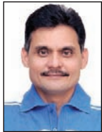
તંત્રી - પ્રકાશક સ્વદેશ

ઉત્તર પ્રદેશ અને પંજાબ સહિત પાંચ રાજ્યોમાં યોજાયેલી ચૂંટણીમાં કોંગ્રેસને મળેલી ધોબીપછડાટ પછી ફરીવાર મનોમંથનને