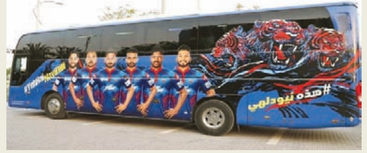
દિલ્હીની કંપનીને બસ કોન્ટ્રાક્ટ આપવાથી નારાજગી

મુંબઈ : મુંબઈમાં દિલ્હી કેપિટલ્સની બસ પર ૫-૬ અજાણ્યા લોકોએ હુમલો કર્યો હતો. જે બાદ હલચલ મચી ગઈ હતી. મહારાષ્ટ્ર નવનિર્માણ સેના (MNS)ના કાર્યકરો દ્વારા આ હુમલો કરવામાં આવ્યો હોવાની જાણકારી મળ્યા બાદ પોલીસ દ્વારા MNS ચાર લોકોની અટકાયત કરવામાં આવી હતી.