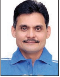
તંત્રી - પ્રકાશક સ્વદેશ

અમેરિકાની પ્રતિનિધિસભાનાં અધ્યક્ષ નેન્સી પેલોસીએ આખરે ચીનની કે કોઈ વિવાદની પરવા કર્યા વિના તાઈવાનની મુલાકાત કરી. હવે ચીન આ બાબતથી અકળાયુ છે અને ગુરુવારે તેણે તાઈવાન ઉપર 11 જેટલી બેલેસ્ટિક મિસાઈલ દાગી હોવાનો દાવો કર્યો હતો. આ સાથે જ અમેરિકા અને ચીન વચ્ચે ફરી મોટી તકરાર થવાની સંભાવના છે.