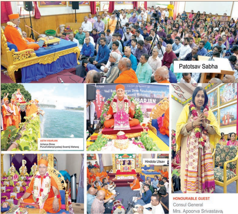
On this auspicious event we have a guests Sants from BAPS Sanstha and a guests from Yogi Divine Society.