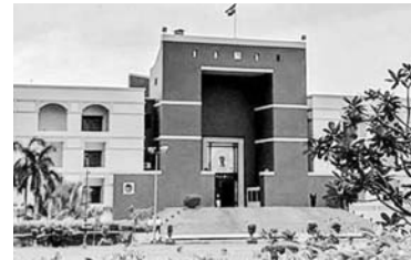
ઓપરેટિંગ પ્રોસેસ (SOP)ની કડક તાકીદ કરી હતી.

એશિયાટિક સિંહો માટે જગવિખ્યાત ગીર અભ્યારણ્ય ક્ષેત્રમાં સિંહોના મોત મામલે ગુજરાત હાઈકોર્ટે રેલ્વે સત્તાવાળાઓ અને વન અધિકારીઓને ફટકાર લગાવી છે. સિંહોની સુરક્ષા મામલે દાખલ જાહેર હિતની અરજીની સુનાવણી દરમિયાન આજે ચીફ જસ્ટિસ સુનિતા અગ્રવાલ અને અનિરુદ્ધ માયીની બેન્ચે રેલ્વે સત્તાવાળાઓ અને રાજ્ય સરકારના સત્તાધીશોને બહુ માર્મિક ટકોર કરી સિંહોના મોત મુદ્દે ઝીરો અકસ્માત પોલિસીનો અમલ કરવા સ્ટાન્ડર્ડ