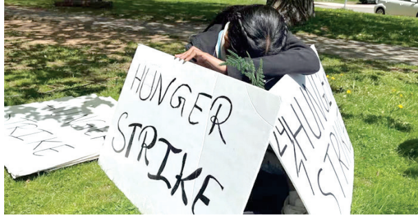
બીજી બાજુ સંસદમાં રુપિન્દરપાલસિંહે જણાવ્યું હતું કે, ભારતીય વિદ્યાર્થીઓએ શિક્ષણ માટે કેનેડિયન વિદ્યાર્થીઓની

કેનેડાના સૌથી નાના પ્રાંત પ્રિન્સ એડવર્ડ આઇલેન્ડ (પીઈઆઈ)એ કેટલાક દિવસ પહેલા તેની ઈમિગ્રેશન પરમિટમાં 25 ટકા ઘટાડો કર્યો હતો. તેના પગલે ત્યાં ભારતીય વિદ્યાર્થીઓને પરત મોકલવામાં આવે તેવો ડર છે. આ બાબતને લઈને ભારતીય વિદ્યાર્થીઓ પાંચ દિવસથી ભૂખ હડતાળ પર બેઠેલા છે. ભારતીય વિદ્યાર્થીઓનું કહેવું છે કે, કેનેડિયન પ્રાંતે તેમની ઈમિગ્રેશન નીતિમાં અચાનક ફેરફાર કરતાં તેમને અનિશ્ચિત સ્થિતિ સર્જાઈ છે. બે ભારતીય વિદ્યાર્થીઓએ ત્યાંની સંસદમાં પણ આ અંગે વાત કરી છે તેમણે સંસદમાં જણાવ્યું હતું કે, તમારી ઈમિગ્રેશન નીતિ કેમ અન્યાયપૂર્ણ છે.