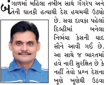
તંત્રી - સ્વદેશ

દેશમાં નારીની અસુરક્ષા મામલે છેડાયેલી ચર્ચાનું એપી સેન્ટર બન્યું છે.