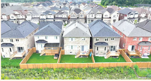
છતાં કેનેડિયન હાઉસિંગ માર્કેટ પ્રવૃત્તિ હજુ પણ તે જ હોલિડિંગ પેટર્નમાં અટવાયેલી જોવા મળે છે, જે તે આખા વર્ષમાં હતી.