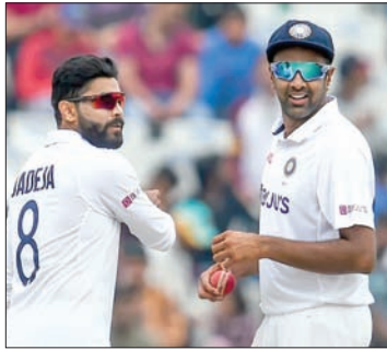
બોલર બની શકે છે. હાલમાં આ સિદ્ધિ ઓસ્ટ્રેલિયાના જોશ હેઝલવુડના નામે છે. હેઝલવુડે WTC 2023-25 માં 52 વિકેટ લીધી છે. તેવામાં કાનપુરમાં

અશ્વિન કાનપુર ટેસ્ટ દરમિયાન વર્લ્ડ ટેસ્ટ ચેમ્પિયનશિપ 2023-25 (WTC)માં સૌથી વધુ વિકેટ લેનાર