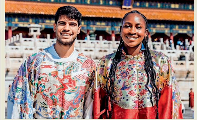
ચાઇના ઓપન ટેનિસ ટૂર્નામેન્ટમાં ભાગ લેવા આવેલા સ્પેનના કાર્લોસ અલ્કારાઝ અને અમેરિકાની સ્ટાર ખેલાડી કોકો ગોફે ચીનના પરંપરાગત ટ્રેસમાં ફોર્મિડાબલ સિટીની મુલાકાત લીધી હતી. બંને ખેલાડીઓએ ચીનની સંસ્કૃતિ અંગે જાણકારી મેળવી હતી. ટૂર્નામેન્ટમાં ભાગ લેનાર વિશ્વના અન્ય કેટલાક ખેલાડીઓએ પણ શહેરમાં આવેલા વર્ષો જૂના સ્મારકોની મુલાકાત લીધી હતી.