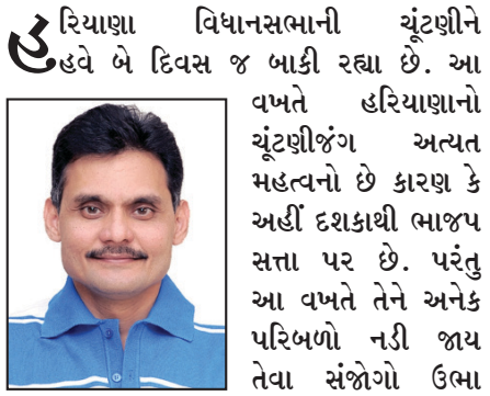
તંત્રી - સ્વદેશ

હરિયાણા વિધાનસભાની ચૂંટણીને હવે બે દિવસ જ બાકી રહ્યા છે. આ વખતે હરિયાણાનો ચૂંટણીજંગ અત્યંત મહત્વનો છે કારણ કે અહીં દશકાથી ભાજપ સત્તા પર છે. પરંતુ આ વખતે તેને અનેક પરિભળો નડી જાય તેવા સંજોગો ઉભા થયા છે. ભારતીય જનતા પાર્ટી અને કોંગ્રેસ બંનેએ પોતપોતાના મેનિફેસ્ટો બહાર પાડ્યા છે. કોંગ્રેસ તાજેતરમાં યોજાયેલી સામાન્ય ચૂંટણીઓમાં તેના પ્રદર્શનથી ઉત્સાહિત છે અને તે ૧૦ વર્ષ પછી રાજ્યમાં સત્તા મેળવવાની પેરવીમાં છે. જ્યારે ભાજપ ૧૦ વર્ષથી સત્તા પર હોવાથી સત્તાવિરોધી લહેર, ખેડૂતોનું આંદોલન, કુસ્તીબાજોનો વિરોધ અને અગ્નિવીર યોજના જેવા મુદ્દાઓને કારણે ભીંસમાં મુકાઈ ગયું છે. હરિયાણાના ચૂંટણી જંગમાં