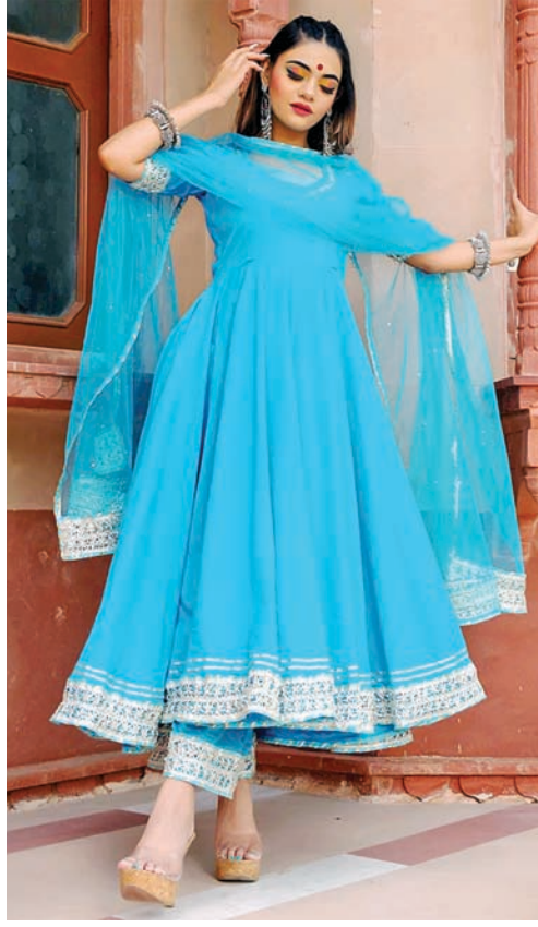
અનારકલી વિથ ગોટાવર્ક

અનારકલી કુરતીની ફેશન ઇન ટ્રેન્ડ છે. આ ટ્રેન્ડિશનલ આઉટફિટમાં બો ડાર્ક કલરમાં ગોલ્ડન અથવા સિલ્વર ગોટાનું કોમ્બિનેશન કરવામાં આવે તો રોચલ લુક આપે છે. અનારકલીમાં ખાસ કરીને તેના લેયરમાં ગોટાપટ્ટી લગાવવામાં આવે છે. સૂટની નેકલાઇન સિમ્પલ છે તો તેને ફેન્સી બનાવવા માટે તેના ઉપર ગોટાપટ્ટીનો ઉપયોગ કરી શકો છો. અનારકલીના નીચેના ભાગમાં પણ ગોટાપટ્ટીને લગાવી શકાય છે. આમ, ગોટાપટ્ટી દ્વારા સિમ્પલ સૂટને આકર્ષક બનાવી શકાય છે, જે તમને ગોર્જિયસ લુક આપશે.