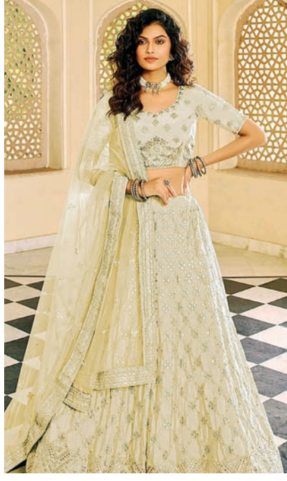
ક્રીમ અને ગોલ્ડન ગોટાવર્ક

ફેશનની દુનિયા વિશાળ છે. આજે જે ટ્રેન્ડમાં છે તે કાલે આઉટ ઓફ ટ્રેન્ડ થઈ જાય છે, પરંતુ એવા ઘણા ટ્રેન્ડ્સ છે, જે વર્ષોથી ફેશનની દુનિયામાં રાજ કરી રહ્યા છે. એવો જ એક ટ્રેન્ડ ગોટાપટ્ટી વર્કનો છે. સાડી હોય કે સૂટ ગોટાપટ્ટી વર્ક હંમેશાં ફેવરિટ રહ્યું છે. આ વર્કની ખાસિયત એ છે કે તે દેખાવમાં જેટલા હેવી દેખાય છે પહેરવામાં એટલા જ લાઈટવેટ હોય છે. તેથી પાર્ટી અને નાના-મોટા પ્રસંગો ઉપરાંત ડેઈલીવેરમાં મહિલાઓ તેને પહેરવાનું પસંદ કરે છે.