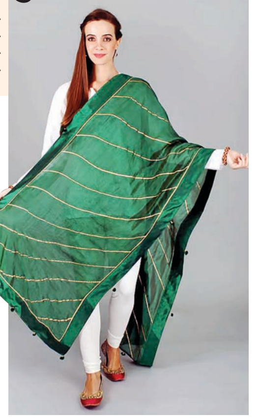
ગોટા જેકેટ વિથ દુપટ્ટા

કોઈ પણ બીજા વર્કની સાથે પણ સાટું લાગે છે. હેવી વર્ક અનારકલી સૂટની સાથે ગોટાવર્ક દુપટ્ટા કેરી કરી શકો. દુપટ્ટાની બોર્ડરને ફરતે હેવી ગોટાપટ્ટી મૂકવાથી દુપટ્ટો હેવી થઈ જશે. હેવી લુક આપવા માટે ગોટા ટેસલ્સનો ઉપયોગ કરી શકાય છે. ગોટા ટેસલ્સ સરળતાથી માર્કેટમાં મળી જશે. એનાથી તમારા લુકમાં ચાર ચાંદ લાગી જશે.