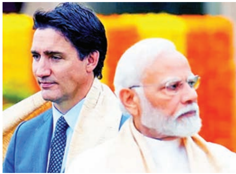
ભારત કેનેડા સંબંધોમાં નુકસાન માટે માત્ર ટૂડો જવાબદાર- વિદેશ મંત્રાલયનો જવાબ

ઓટાવા નિજ્જર હત્યા કેસમાં કેનેડાના પીએમ જસ્ટિન ટૂડોએ પાંચ દિવસ પહેલાં ભારત પર ફરી આરોપો મુક્યા હતા. આ સમયે તેમણે જણાવ્યું હતું કે, હત્યા કેસની તપાસમાં ભારતને અમોએ વારંવાર સહકાર આપવા જણાવ્યું હતું. આમ છતાં ભારત સતત અમારી માંગને અવગણતુ રહ્યું છે. ફાઈવ આઈઝ એલાયન્સે અમને હત્યા કેસમાં ભારતનો હાથ હોવાના પુરાવા આપ્યા છે. ટૂડોના આ નિવેદન બાદ ભારતે કેનેડાના રાજદ્વારીઓને પરત મોકલવા ઉપરાંત ત્યાંથી ભારતના રાજદૂતોને પણ તેડાવી લીધા હતા. ભારતના આ વલણ બાદ ટૂડો વિવાદમાં સપડાયા હતા. કેનેડામાં જ મીડિયા દ્વારા સવાલો ઉઠાવવા માંડ્યા હતા. સાથે જ કેનેડાને પણ નુકસાન થવાની સંભાવના વર્તાવા માંડી હતી. ઉપરાંત લિબરલ પાર્ટીના 20 જેટલા સાંસદોએ ટૂડોનું રાજીનામું પણ માંગ્યું હતું. એક સાંસદે કહ્યું હતું કે, ટૂડોએ પદ પરથી રાજીનામું આપી દેવું જોઈએ, કારણકે, તેમની પસંદગી મતદારોએ કરી હતી. અને તેઓ હવે વડાપ્રધાનને નાપસંદ કરી રહ્યા છે.