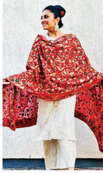
હેવી વર્ક ગોટા દુપટ્ટા

જેમને હેવી વર્ક ન ગમતું હોય તેમના માટે ક્રીમ કલરના સૂટ પર રેડ પટ્ટી અને ગોલ્ડન ગોટાનું કામ કરી શકાય છે. ક્રીમ કલરના કુરતાના બોટમ પર પણ આ પેટર્નને ફોલો કરી શકાય છે. ગોટાવર્કને કારણે આ સૂટ યુનિક અને આકર્ષક લાગશે. એમાંય બે ટ્રાયંગલ ગોટા લેસનો ઉપયોગ કરવામાં આવે તો વધુ આકર્ષક લાગશે. તમે તમારી પસંદ અનુસાર લગાવી શકો છો.