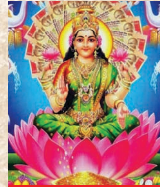
આ દિવસે આચાર્ય પાસે પ્રતિષ્ઠા કરી મૂકાયેલા વિવિધ યંત્રનું નિયમિત પૂજન-અર્ચનથી સફળતા મળે છે

સામાન્ય વેપાર, વ્યવસાયથી શરૂ કરી મોટા વિશાળ વિપુલ-ઉદ્યોગધંધા સાથે સંકળાયેલા સૌ કોઈને માટે નૂતન વર્ષના પ્રારંભે લાભપંચમી એક ઉત્સવ સમાન છે. આ તો શુભ, લાભ અને સ્વસ્તિકની મંગળકાળી તિથિ છે. આ દિવસે શુભ કાર્યનો આરંભ કરવા પંચાંગ-શુદ્ધિ જોવાની જરૂર રહેતી નથી. મહદ્અંશે આ દિવસે ધંધાર્થીઓ પોતાના ક્ષેત્રમાં કામકાજનો મંગલમય શુભારંભ કરતા હોય છે, આરાધ્યદેવી-દેવતાઓનું પૂજન-અર્ચન, નૈવેદ્ય ધરાવી પોતાના ધંધાકીય ક્ષેત્રમાં નૂતન વર્ષપર્યંત ઈશ્વરીય કૃપા થકી સુખ, શાંતિ, સમૃદ્ધિ અને ઐશ્વર્યનું સ્થાપન થાય. ઘણી વેપારી પેઢીઓમાં રૂઢિગત પરંપરા અનુસાર આ દિવસે ચોપડાપૂજન સહિત લક્ષ્મીપૂજન પણ કરવામાં આવતું હોય છે. વ્યવસાયના સ્થળના ઉભરા ઉપર શુભ,લાભ જેવા શબ્દો લખીને સ્વસ્તિકનું ચિહ્ન કરાય છે. નવા વર્ષના હિસાબના ચોપડામાં ‘શ્રી11’ લખીને સવાઈ લક્ષ્મી પ્રાપ્ત કરવા સંકલ્પ કરાય છે. નવા વેપાર-વ્યવસાય, નાનાંમોટાં ઉદ્યોગ ક્ષેત્રમાં વેપાર વૃદ્ધિ કારિણી મહાલક્ષ્મીની પૂર્ણ કૃપા પ્રાપ્ત થાય તે અર્થે આ દિવસે શ્રીયંત્ર, શ્રીમેરુયંત્ર, હંસવાહિની સરસ્વતીયંત્ર, સર્વકાર્ય સિદ્ધિ યંત્ર કે એકાક્ષી શ્રીફળ આચાર્ય પાસે પ્રાણપ્રતિષ્ઠા કરાવીને મૂકાય છે. આ યંત્રનું નિયમિત ધૂપ-દીપ સહિત પૂજન-અર્ચન કારવાથી ધંધામાં સફળતા મળે છે. યંત્રપૂજા નિમિત્તે શ્રીસુક્તના પાઠ, સિદ્ધિ લક્ષ્મી સ્તોત્ર, લક્ષ્મી સ્તવન, કનકધારા સ્તોત્ર વગેરેનું પઠન કરવાથી વિશેષ ફળ પ્રાપ્ત થાય છે.