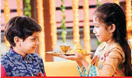
ભાઈબીજના પવિત્ર દિવસે કુરુક્ષેત્ર, મથુરા, સંગમતીર્થો તથા પવિત્ર નદીઓમાં પણ યમુનાજીનું સ્મરણ કરીને સ્નાન કરવાથી યમુનાસ્નાનનું ફળ પ્રાપ્ત થાય છે

તેમની નાની બહેન યમુનાજીને ત્યાં આ દિવસે ભોજન ગ્રહણ કર્યું હતું. યમરાજાએ પોતાની બહેનને વરદાન આપ્યું હતું કે, હે યમુને! આ દિવસે જે પરણેલી બહેન પોતાના ભાઈને સાસરિયામાં બોલાવીને પ્રેમથી ભોજન કરાવશે તો તેને યમયાતના ભોગવવી પડશે નહીં. બીજું વરદાન આપ્યું કે હે યમુને! આ દિવસે જે મનુષ્યો તારા પવિત્ર જળમાં સ્નાનપાન કરીને તારું સ્મરણ કરશે તથા સૂર્યનારાયણને અર્ધ આપશે તેને પણ યમયાતનામાંથી છુટકારો મળશે તથા પાપો નિર્મૂળ બનશે.