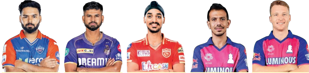
ઋષભ પંત LSG રૂ. 27 કરોડ શ્રેયસ ઐયર PBKS રૂ. 26.75 કરોડ અર્શદીપ સિંહ PBKS રૂ. 18.00 કરોડ યજુવેન્દ્ર ચઢલ PBKS રૂ. 18.00 કરોડ જોસ બટલર GT રૂ. 15.15 કરોડ

IPL ઓક્શનમાં સૌથી મોંઘા ખેલાડીની યાદીમાં પ્રથમ ઋષભ પંત છે જેને લખનઉએ ૨૦ કરોડ રૂપિયામાં ખરીદ્યો છે. બીજા નંબરે શ્રેયસ ઐયરને પંજાબે ૨૬.૭૫ કરોડમાં ખરીદ્યો છે. ત્રીજા નંબરે મિચેલ સ્ટાર્ક છે જેને કોલકાતાએ ૨૦૨૪માં ૨૪.૭૫ કરોડમાં, ચોથા ક્રમે પેટ કમિન્સને ૨૦૨૪માં હૈદરાબાદે ૨૦.૫૦ કરોડમાં, પાંચમા ક્રમે સ્ટેમ કરનને પંજાબે ૨૦૨૩માં ૧૮.૫૦ કરોડમાં, છઠ્ઠા ક્રમે કેમરોન ગ્રીનને ૨૦૨૩માં મુંબઈ ઇન્ડિયન્સે ૧૭.૫૦ કરોડમાં, સાતમા ક્રમે બેન સ્ટોકસને ૨૦૨૩માં ચેન્નાઈએ ૧૬.૨૫ કરોડમાં, આઠમા ક્રમે ક્રિસ મોરિસને ૨૦૨૧માં રાજસ્થાને ૧૬.૨૫ કરોડમાં, નવમા ક્રમે નિકોલસ પૂરનને ૨૦૨૩માં લખનઉએ ૧૬ કરોડમાં અને ૧૦મા ક્રમે ૨૦૧૫માં યુવરાજ સિંહને દિલ્હીએ ૧૬ કરોડમાં ખરીદ્યો હતો.