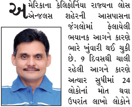
તંત્રી - સ્વદેશ

અમેરિકાના કેલિફોર્નિયા રાજ્યના લોસ એન્જલસ શહેરની આસપાસના જંગલોમાં ફેલાયેલી ભયાનક આગને કારણે ભારે ખુંવારી થઈ ચુકી છે. 9 દિવસથી ચાલી રહેલી આગને કારણે અત્યાર સુધીમાં 24 લોકોનાં મોત થવા ઉપરાંત લાખો લોકોને ઘર છોડવાની ફરજ પડી છે. જ્યારે લોસ એન્જલસના ઈતિહાસમાં સૌથી વિનાશક કહેવાતી આ આગમાં અત્યાર સુધીમાં 12,000થી વધુ ઈમારતો બળીને રાખ થઈ ગઈ છે. એટલું જ નહીં, 60,000 અન્ય ઈમારતો જોખમમાં છે. લોસ એન્જલસ શહેરમાં હોલિવૂડનું હેડ ક્વાર્ટર આવેલું હોવાથી આ વર્ષના ઓસ્કાર નોમિનેશન પણ બે દિવસ માટે મોકૂફ રાખવામાં આવ્યા. આ આગમાં હોલિવૂડના અનેક ફિલ્મ સ્ટાર્સનાં ઘર પણ બળીને ખાખ થઈ ગયાં છે.