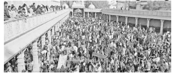
શ્રદ્ધા મુજબ કે બાળકના વજન જેટલા બોર ઉછામવાની માનતા કરવામાં આવે છે. ચાલુ વર્ષે પણ શ્રદ્ધાળુઓ માનતા પૂરી કરવા માટે આવ્યાં હતાં. શ્રદ્ધાળુઓ હજારો મણ બોરની ઉછામણી કરી હતી. આ બોરની પ્રસાદી ઝીલવા માટે શહેર સહિતના દર્શનાર્થીઓ મંદિર ખાતે ઉમટી પડ્યાં હતાં અને બોરને ઝીલી પ્રસાદી ગ્રહણ કરી હતી.

પોષી પૂનમે નરિયાદના સંતરામ મંદિરે શ્રદ્ધાળુઓ બાળક બોલતું થાય તે માટેની બોર ઉછામણીની માનતા પૂરી કરવા માટે ઉમટયાં હતાં. ભક્તોએ હજારો મણ બોરની ઉછામણી કરી હતી, જેને નીચે ઉભા રહેલા અન્ય ભક્તોએ હોંશે હોંશે ઝીલીને પ્રસાદી ગ્રહણ કરી હતી. સમગ્ર મંદિર પરિસર 'જય મહારાજ'ના જયઘોષથી ગુંજી ઉઠ્યું હતું. જોકે, ટ્રાફિક માટે સુચારુ વ્યવસ્થાના અભાવે શહેરમાં ઠેર ઠેર ચક્કાજામની સ્થિતિ સર્જાઈ હતી. કોઈ બાળક બોલતું ન હોય અથવા તોતું બોલતું હોય તો તેના માતા-પિતા કે સ્વજન દ્વારા સંતરામ જ્યોતની બાધા રાખવામાં આવે છે. બાળક બોલતું થાય તો સંતરામ મહારાજના સમાધિ સ્થાન એટલે કે સંતરામ મંદિરના પટાંગણમાં સવા કિલોથી લઈ યથાશક્તિ,