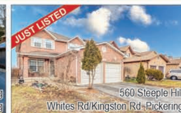
560 Steeple Hill Whites Rd/Kingston Rd -Pickering

Welcome Home To This Beautiful 3+1 Bedroom Detached Bungalow Located In The Sought-After Bay Ridge Community in Pickering. Get to experience the joy of living walking distance from the Go station (Appx 30 min to downtown), Walking Trails, Beach, Millennium Square, Pickering Mall, Transit, parks, schools, Big Grocery Stores, Recreation Centre, restaurants, Minutes to Hwy 401 & Frenchman's Bay Marina. Walkout to Deck. Fenced Backyard, Separate Side Entrance Leading To A Fully-Equipped Basement Apartment. Perfect For Rental Income Or Extended Family. Separate laundry area. Backs onto School, Good size driveway can fit 5 Cars, Open Concept Living & Dining brings in lots of sunshine. Move in ready whether you want to Stay and rent out the basement or Build your dream home.