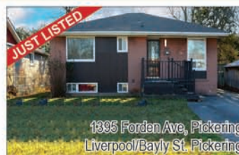
1395 Forden Ave, Pickering Liverpool/Bayly St. Pickering

Welcome Home To This Beautiful 3+1 Bedroom Detached Bungalow Located In The Sought-After Bay Ridge Community in Pickering. Get to experience the joy of living walking distance from the Go station (Appx 30 min to downtown), Walking Trails, Beach, Millennium Square, Pickering Mall, Transit, parks, schools, Big Grocery Stores, Recreation Centre, restaurants, Minutes to Hwy 401 & Frenchman's Bay Marina. Walkout to Deck. Fenced Backyard, Separate Side Entrance Leading To A Fully-Equipped Basement Apartment. Perfect For Rental Income Or Extended Family. Separate laundry area. Backs onto School, Good size driveway can fit 5 Cars, Open Concept Living & Dining brings in lots of sunshine. Move in ready whether you want to Stay and rent out the basement or Build your dream home.