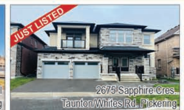
2675 Sapphire Cres Taunton/Whites Rd, Pickering

Very Bright & Spacious Layout Home in Prime Location. Well maintained house with 4 Bedrooms, 3 Bath with W/O to large deck through breakfast area. Kitchen with Granite Countertop and Stainless Steel Appliances. Separate Entrance to basement with 2 Bedrooms, Kitchen and Washroom, Separate laundry in basement. Great Neighborhood And An Easy Access Location To All Amenities, Shopping, Restaurants, Schools. Short Walk To Nearby Neighborhood Children's Park. Few Minutes To 401.