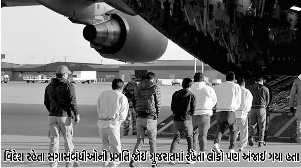
વિદેશ રહેતા સગાસંબંધીઓની પ્રગિતિ જોઈ ગુજરાતમાં રહેતા લોકો પણ અંજાઈ ગયા હતા

માણસા તાલુકાના બોરુ ગામનો એક પરિવાર એક મહિના અગાઉ જ અમેરિકા ગયો હતો અને ત્યાં પકડાઈ ગયા બાદ હવે તેમને પરત મોકલી દેવામાં આવ્યા છે. આ લોકોમાંથી ઘણાંના માતા-પિતા તો આ વિશે કશું જાણતા જ નથી તો અમુક પરિવારજનો પોતાના મકાન બંધ કરીને સગા-સંબંધીઓને ત્યાં જતા રહ્યાં છે.