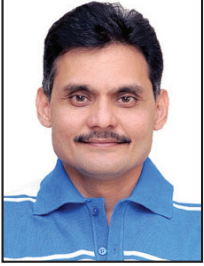
તંત્રી - સ્વદેશ

ડોનાલ્ડ ટ્રમ્પે પ્રમુખ બનતાં જ અમેરિકામાં ગેરકાયદે રહેતા વિદેશીઓને હાંકી કાઢવાની ઝુંબેશ મોટા ઉપાડે શરૂ કરી દીધી છે. આ સાથે જ હજારો ભારતીયો પણ ભેરવાઈ પડ્યા છે.