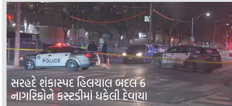
સરહદે શંકાસ્પદ હિલચાલ બદલ 6 નાગરિકોને કસ્ટડીમાં ધકેલી દેવાયા