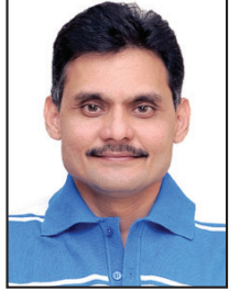
તંત્રી - સ્વદેશ

ભારતના વડાપ્રધાન નરેન્દ્ર મોદીના અમેરિકાના પ્રવાસને લઈને ભારતીયોમાં ખાસ ઉત્કાંઠાઓ હતી. ખાસ કરીને ટેરિફ અને ડિપોઝિશન અભિયાન મુદ્દે કોઈ સકારાત્મક નિર્ણય લેવાય તેવી સંભાવના હતી. જો કે, આ બંને મુદ્દાઓ પર ખાસ કોઈ નિષ્કર્ષ આવ્યો ન હતો. તેમ છતાં બંને નેતાઓએ એકમેકને સારા મિત્રો હોવાની વાત દોહરાવીને વેપારમાં આગળ વધવાનું વચન આપ્યું હતું. જો કે, મોદી સાથેની બેઠક પહેલાં જ ટ્રમ્પે રેસિપ્રોકલ ટેરિફ અંગેની દરખાસ્ત પર હસ્તાક્ષર કરીને આખી દુનિયાને સ્પષ્ટ સંકેત આપી દીધો હતો કે, જે દેશ તેની સાથે જેવું વર્તન કરશે, અમેરિકા પણ તેની સાથે તેવો જ વર્તવ કરશે.