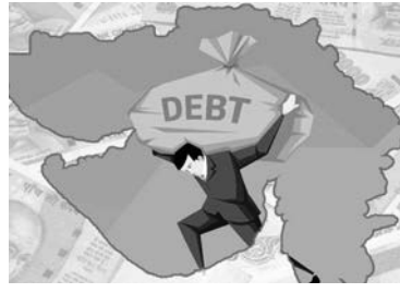
સરકારે 2024-25ના વર્ષમાં 76,000 કરોડ રૂપિયાનું દેવું લીધું છે. ગુજરાતના એક નાગરિકને માથે અંદાજે 2,95,308 રૂપિયાનું દેવું છે. આમ, ગુજરાત સરકારની એકની આવકમાંથી 8.83 પૈસા તો રાજ્યના દેવા પરના વ્યાજની ચૂકવણી કરવામાં જ ખર્ચાઈ જાય છે.

ગુજરાત સરકારનું જાહેર દેવું 2023-24માં 3,77,96 કરોડ રૂપિયાનું હતું. તેની સામે 2025-26ના વર્ષમાં જાહેર દેવું વધીને 4,55,537 કરોડ રૂપિયાનો અંદાજ આપવામાં આવ્યો છે. આમ, છેલ્લાં બે વર્ષમાં ગુજરાત સરકારે તેના દેવામાં રોજના 1063.26 કરોડ રૂપિયાનો વધારો કર્યો છે. આ દેવાનું વ્યાજ ચૂકવવા માટે રોજના ગુજરાત સરકાર 68.82 કરોડ રૂપિયા ખર્ચી રહી છે. GDPના મૂલ્ય સાથે જાહેર દેવાની ટકાવારી કાઢવામાં આવે તો તે 14.96 ટકાની આસપાસની છે. ગુજરાત સરકારે 2024-25ના વર્ષમાં 76,000 કરોડ રૂપિયાનું દેવું લીધું છે. ગુજરાતના એક નાગરિકને માથે અંદાજે 2,95,308 રૂપિયાનું દેવું છે. આમ, ગુજરાત સરકારની એકની આવકમાંથી 8.83 પૈસા તો રાજ્યના દેવા પરના વ્યાજની ચૂકવણી કરવામાં જ ખર્ચાઈ જાય છે.