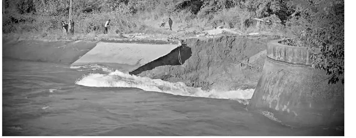
સુરત : સુરતમાં માંડવીના ઉશ્કેર નજીક આવેલી કેનાલમાં મોટું ભંગાણ થયું હતું. કેનાલના ભંગાણના કારણે પાણી નજીકના ખેતરોમાં પહોંચી ગયાં હતાં. જેનાથી ખેડૂતોને ભારે નુકસાન થવાની સંભાવના છે. હાલ સિવાય સિંચાઈ અધિકારીઓ હાલ ઘટનાસ્થળે પહોંચી ગયાં હતાં. જોકે, હજુ સુધી પાણીનો પ્રવાહ બંધ થતાં ક્લાકોનો સમય લાગી શકે છે. પાણીનો પ્રવાહ રોકાઈ નથી રહ્યો ત્યારે ખેડૂતોને પાકને નુકસાન થવાનો ભય છે. નોંધનીય છે કે, આ અગાઉ પણ આ કેનાલમાં ભંગાણ થયું હતું. જેના કારણે કેનાલના સમારકામમાં ભ્રષ્ટાચારની આશંકા વ્યક્ત કરવામાં આવી રહી છે.

ભરૂચ ગુજરાતના ભરૂચમાં લગ્ન પહેલાં વરઘોડામાં મારામારીની ઘટના સામે આવી છે. વરરાજા પોતાની લાડી લેવા જઈ રહ્યા હતાં, તે પહેલાં વરઘોડા દરમિયાન બેન્ડ વગાડવા મુદ્દે મારામારી થઈ હતી. બેન્ડના અવાજથી ભેંસ ભડકી હતી, જેના કારણે બે જૂથ વચ્ચે મારામારી થઈ હતી. સમગ્ર મામલે પોલીસમાં ફરિયાદ નોંધવામાં આવી છે, પોલીસે આ મામલે વધુ તપાસ હાથ ધરી છે. ભરૂચના નવા તવરા ગામે લગ્નનો પ્રસંગ હતો. વરરાજા પોતાની લાડીને પરણવા જઈ રહ્યાં હતાં, તે દરમિયાન જાનૈયાઓ વરઘોડામાં નાચીને લગ્નની