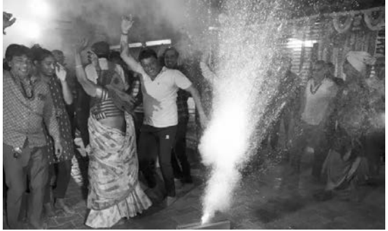
ભાઈ દિનેશ રાવલે કહ્યું કે સુનિતા કોઈ સાધારણ વ્યક્તિ નથી... તે દુનિયા બદલી દેશે...' પુજારી અજયભાઈ ગોસ્વામી જણાવ્યું હતું કે સુનિતા હેમખેમ પરત આવતાં ગામમાં ફટાકડા ફોડીને તેની ઉજવણી કરવામાં આવી હતી.

મહેસાણા : ભારતીય મૂળના અને મહેસાણા જિલ્લાના ઝુલાસણ ગામની વતની તેમજ અમેરિકામાં રહેતા સુનિતા વિલિયમ્સ અંતરિક્ષની સફરથી નવ મહિના બાદ પરત ફર્યા છે. હેમખેમ પરત આવે તે માટે વતનના ઝુલાસણ ગામમાં લોકોએ પ્રાર્થનાઓ કરી હતી અને 108 લઘુરૂદ્ર અને શિવયજ્ઞ કર્યા છે. અંતરિક્ષની સફરે ગયેલા અંતરિક્ષ યાત્રી સુનિતા વિલિયમ્સ અને તેના સાથી કર્મચારી સતત નવ મહિના સુધી અંતરિક્ષમાં અટવાઈ પડ્યા હતા. ત્યારે હવે બુધવારે સવારે 3:27 વાગ્યે સ્પેસએક્સ ડ્રેગન ફીડમ અંતરિક્ષયાનમાં ફ્લોરિડાના દરિયાકાંઠે પૃથ્વી પર ઘરવાપસી કરી છે. સુનિતા વિલિયમ્સના પૈતૃક ગામમાં ઝુલાસણમાં પણ હેમખેમ પરત ફરે તે માટે પ્રાર્થના સહિતનું આયોજન કરવામાં આવ્યું હતું. 9 મહિના સુધી આંતરરાષ્ટ્રીય અંતરિક્ષ સ્ટેશન પર ફસાયેલી સુનિતા વિલિયમ્સ પૃથ્વી પર પરત ફરતાં પિતરાઈ