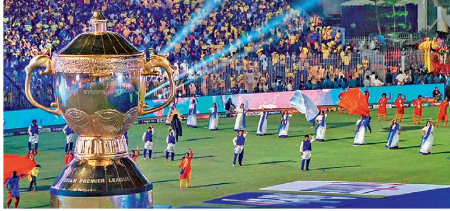
કાર્યક્રમ રજૂ કરશે અને તેની શરૂઆત ૨૨મી માર્ચથી કોલકાતાના ઈડન ગાર્ડન્સની થશે. આ

નવી દિલ્હી : આઈપીએલ ૨૦૨૫ની સિઝનનો આવતીકાલ એટલે કે 22મી માર્ચથી પ્રારંભ થવા જઈ રહ્યો છે. બીસીસીઆઈએ ઓપનિંગ સેરેમની અંગે મહત્વપૂર્ણ નિર્ણય લીધો છે. આઈપીએલની ઓપનિંગ મેચ પહેલાં ૩૦ મિનિટ સુધી કોલકાતાના ઈડન ગાર્ડન્સ ખાતે સેરેમની યોજાશે. જેમાં ઘણા કલાકારો ભાગ લે તેવી સંભાવના છે. એક અહેવાલ અનુસાર બીસીસીઆઈ આઈપીએલની ૧૮મી સિઝનનો ધામધૂમથી મનાવવાનો નિર્ણય કરી ચૂક્યું છે અને આ સ્થિતિમાં તમામ વેન્યૂ ઉપર રમાનારી પ્રથમ મેચ પહેલાં ઓપનિંગ સેરેમની યોજાશે. બીસીસીઆઈ તમામ ૧૩ વેન્યૂમાં વિશેષ