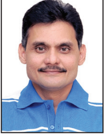
તંત્રી - સ્વદેશ

૨૮ દિવસ સ્પેસમાં ગાળીને સુનિતા-વિલ્મોરે કૂ-૯ના બીજા બે અવકાશયાત્રી એલેક્ઝાન્ડર ગોર્બુનોવ અને નિક હેગ સાથે ૧૯ માર્ચ ૨૦૨૫ના રોજ પરત પૃથ્વી પર આવ્યા. તેણે વહેલી સવારે ફ્લોરિડાના કિનારે ઉતરાણ કર્યું ત્યારે વિશ્વભરના અન્ય અવકાશયાત્રીઓએ પણ રાહતનો શ્વાસ લીધો. કારણ કે, ટ્રેગન સ્પેસ કેમ્પૂલની રીટર્ન