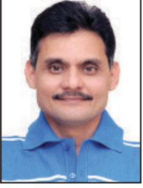
તંત્રી - સ્વદેશ

અમેરિકાના પ્રમુખ ડોનાલ્ડ ટ્રમ્પે 14 દિવસ માટે યુદ્ધવિરામની જાહેરાત કરતાં વિશ્વે હાશકારો અનુભવ્યો છે. પરંતુ આ સાથે જ સૌને મોઢે એક જ વાત છે કે આ યુદ્ધનો અંત નથી, આ ટૂંકા ગાળાનો ઈન્ટરવલ છે. ઈરાન અને અમેરિકા બંને થાકે એવા નથી. ઈરાને યુદ્ધખોર અમેરિકાનો ગર્વ ઉતારી નાખ્યો છે, તો સાથે સાથે અખાતી દેશો સાથેના સંબંધો પણ ખરાબ કરી નાખ્યા છે. ઈરાને પોતાના મિત્ર કહેવાતા અખાતી દેશો ઉપર પણ હુમલા કર્યા હતા.