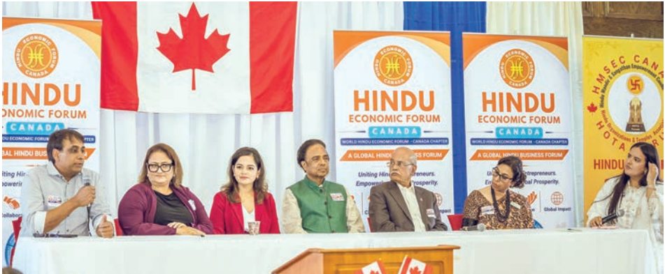
HOTA ફોરમ, 'WHEF' અને 'VHP કેનેડા'ના સંયુક્ત ઉપક્રમે આર્થિક સશક્તિકરણ, નેતૃત્વ અને સહયોગ પર વિશેષ ભાર મૂકાયો

ઓટાવા : ઓટાવામાં 2026ની બીજી કેનેડિયન રાષ્ટ્રીય હિન્દુ પરિષદને જબરદસ્ત સફળતા હતી. પરિષદમાં 75+ મંદિરો, સંગઠનો અને સંગઠનોના પ્રતિનિધિઓ, વ્યાપારી નેતાઓ, વ્યાવસાયિકો, ઉદ્યોગસાહસિકો, યુવાનો અને સમુદાયના સભ્યોને સમુદાય એકતા, આર્થિક વિકાસ, નાગરિક જોડાણ અને નેતૃત્વ અંગે ચર્ચા કરવા માટે એકત્ર કરવામાં આવ્યા હતા. મુખ્યત્વે HOTA ફોરમ કેનેડા, WHEF કેનેડા ચેપ્ટર અને VHP કેનેડા - હિન્દુ ઇકોનોમિક ફોરમ કેનેડા ચેપ્ટરના સત્તાવાર લોન્ચિંગને ચિહ્નિત કરવાના ઉદ્દેશ્ય સાથે યોજાયેલા આ કાર્યક્રમમાં પ્રેરણાદાયક મુખ્ય ભાષણો, પ્રભાવશાળી પેનલ ચર્ચાઓ અને ગતિશીલ નેટવર્કિંગ સત્રોએ સામૂહિક દ્રષ્ટિકોણ અને તેનો હેતુ દર્શાવ્યો હતો. કેનેડાના વિવિધ શહેરોમાંથી દિવસભર અંદાજે ૫૦૦ જેટલા સહભાગીઓ હાજર રહ્યા હતા. કાર્યક્રમને સફળ બનાવવામાં ૬૦થી વધુ સ્વયંસેવકોની ટીમે સવારે ૬ વાગ્યાથી લઈને