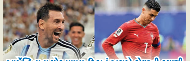
આર્જેન્ટિનાના મોહ પાછળ ફિફાનું અબજો ડોલરની કમાણી

૨૫મી જુલાઈએ રમાયેલી મેચોના અંતે સર્જાયેલા સમિકરણો જોતા ડિફેન્ડિંગ ચેમ્પિયન આર્જેન્ટિના માટે ફાઇનલ સુધીનો માર્ગ અત્યંત સરળ દેખાઈ રહ્યો છે, જ્યારે બ્રાઝિલ, પોર્ટુગલ અને ફ્રાન્સ જેવી અન્ય મજબૂત ટીમો માટે આગળની સફર અત્યંત કપરી બની ગઈ છે. એક તરફ તમામ હેવીવેઈટ ટીમો એક જ હાફમાં એકબીજાને કાપીને બહાર ફેંકાઈ જશે, જ્યારે આર્જેન્ટિના બીજા હાફમાં એકદમ સુરક્ષિત અંતર જાળવી રહ્યું છે, જે આ ડ્રોને ઇતિહાસનો સૌથી અન્યાયી ડ્રો સાબિત કરે છે.